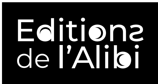
Version deux lignes

A utiliser si la visibilité est insuffisante avec le positif (fond photographique par exemple).