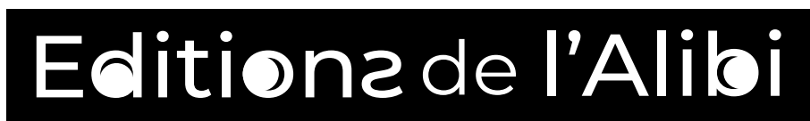
Version une ligne